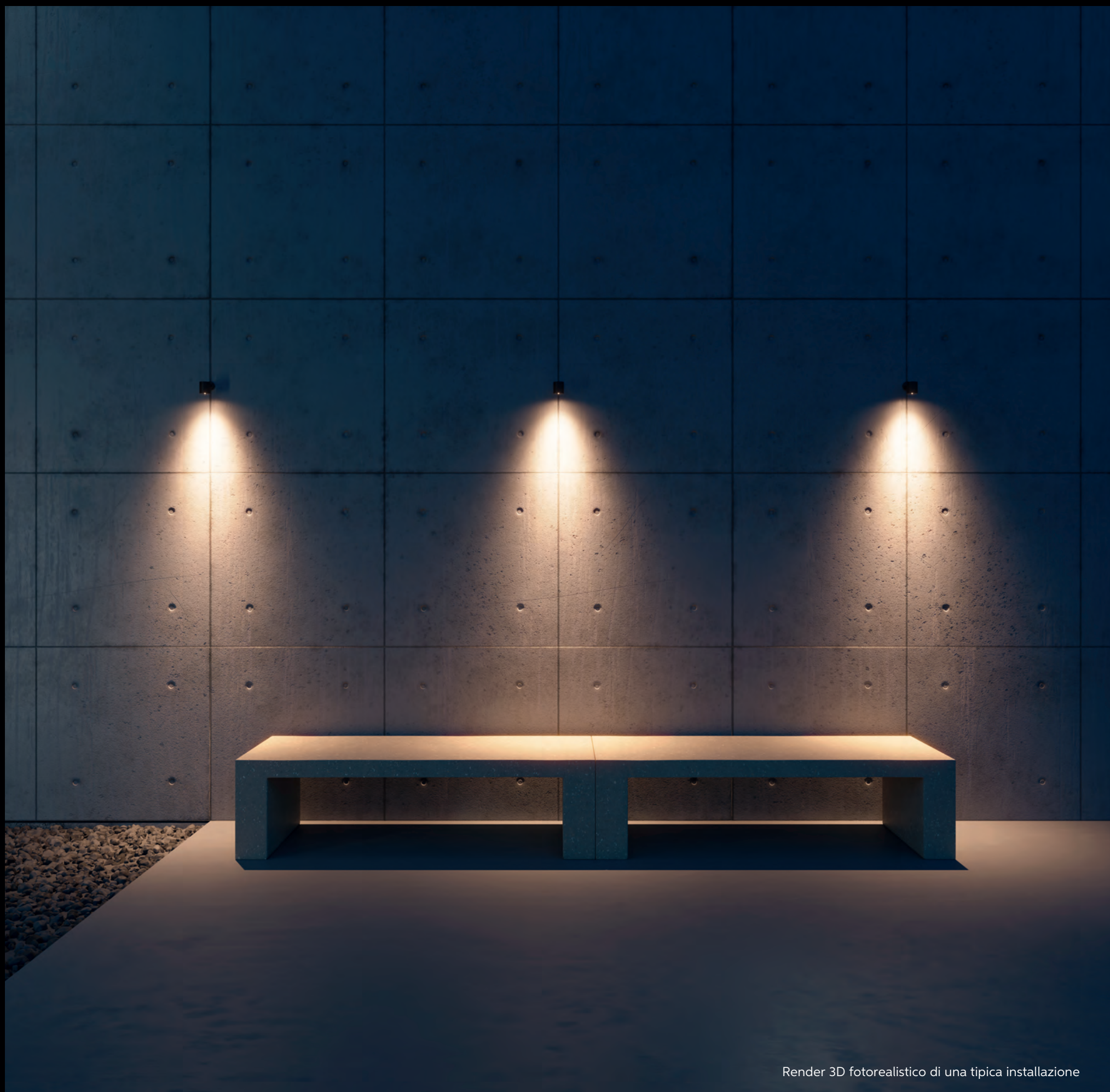
Render 3D fotorealistico di una tipica installazione